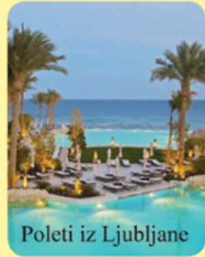
Poleti iz Ljubljane